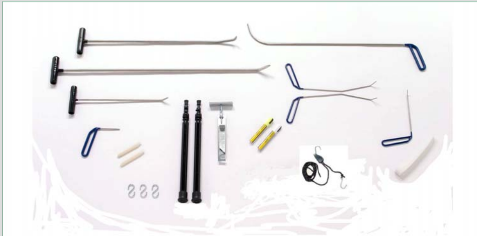
Basic-Satz (8 Werkzeuge + Zubehör)