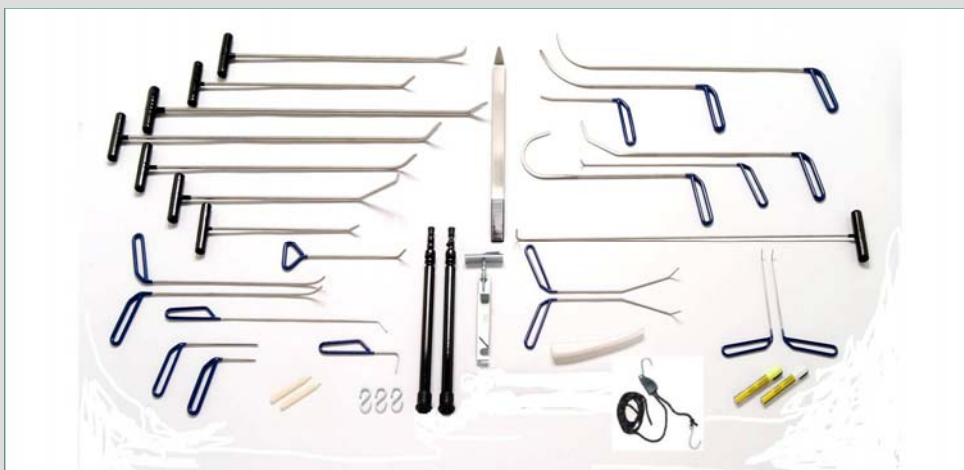
Master-Satz (26 Werkzeuge + Zubehör)