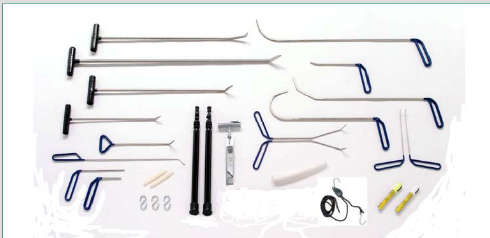
Custom-Satz (16 Werkzeuge + Zubehör)